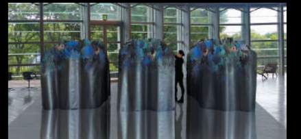
ジェニファー・ウェン・マ《無題—インクのリズム》(イメージ図) 2022年