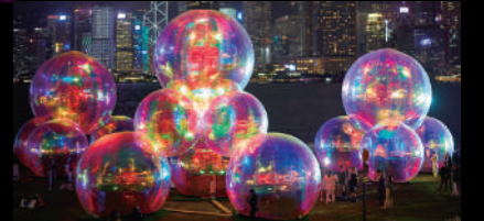
アトリエ シス (エフェメラル コレクション)